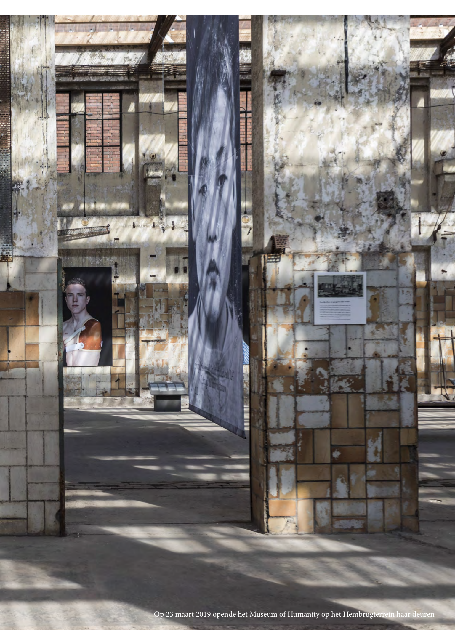
Op 23 maart 2019 opende het Museum of Humanity op het Hembrugterrein haar deuren